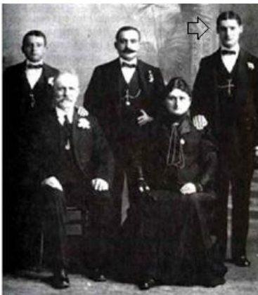
Con sus padres y hermanos