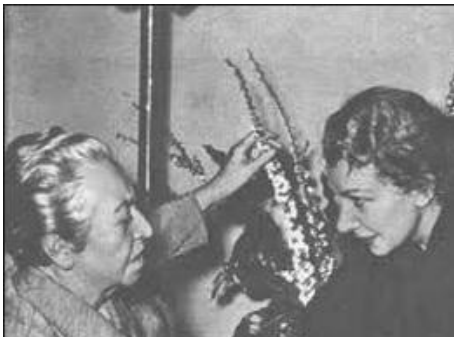
Con Gabriela Mistral

Nuestro nuevo personaje destacado es Lenka Franulić. No cuesta demasiado escribir sobre ella. Su obra y aporte a la cultura y al periodismo nacional constan en numerosos documentos históricos y en el recuerdo de quienes la conocieron.