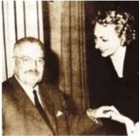
Con el presidente Ibáñez