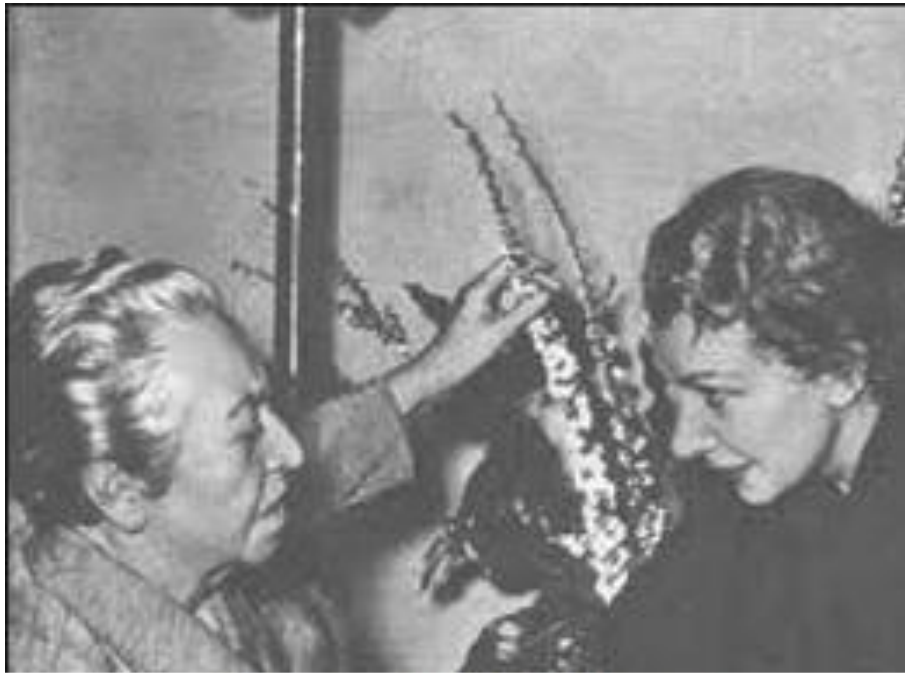
Con Gabriela Mistral