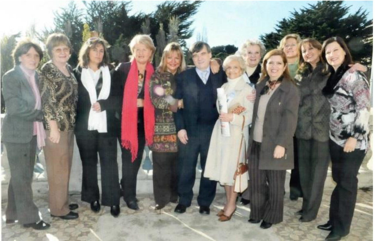
Con el Alcalde de Punta Arenas Vladimiro Mimica