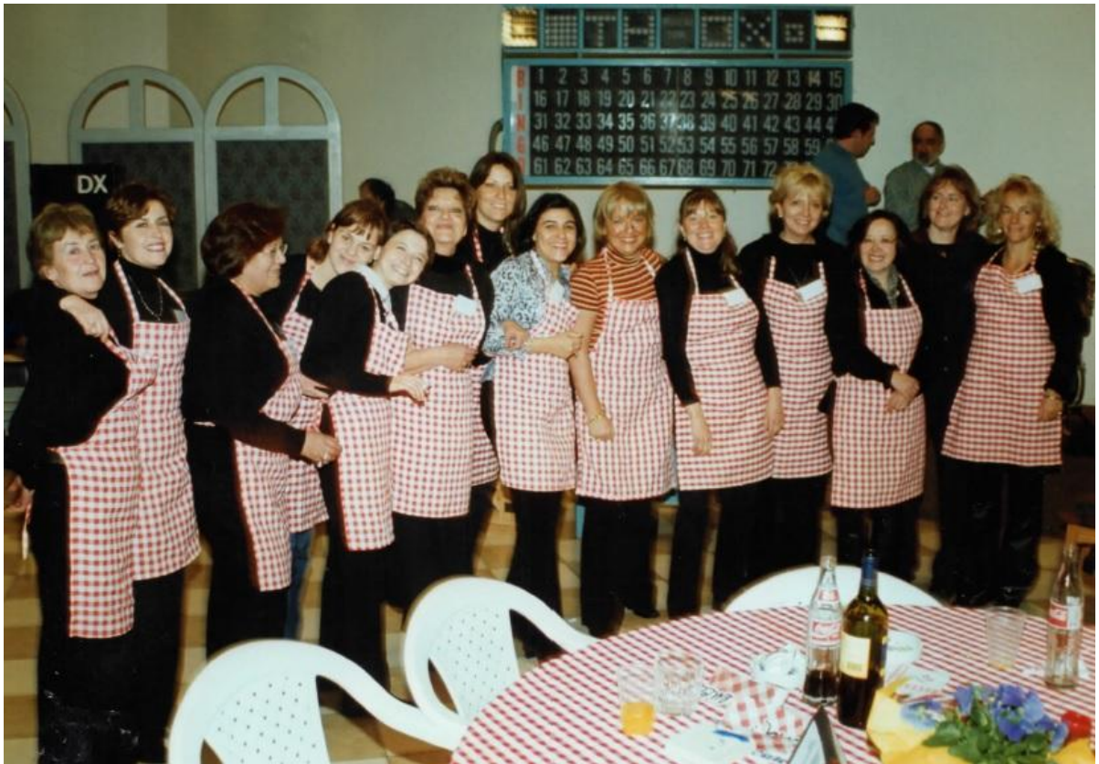
En una tallarinata