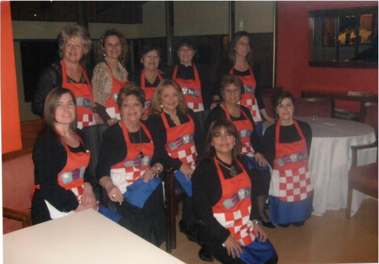
En otra tallarinata