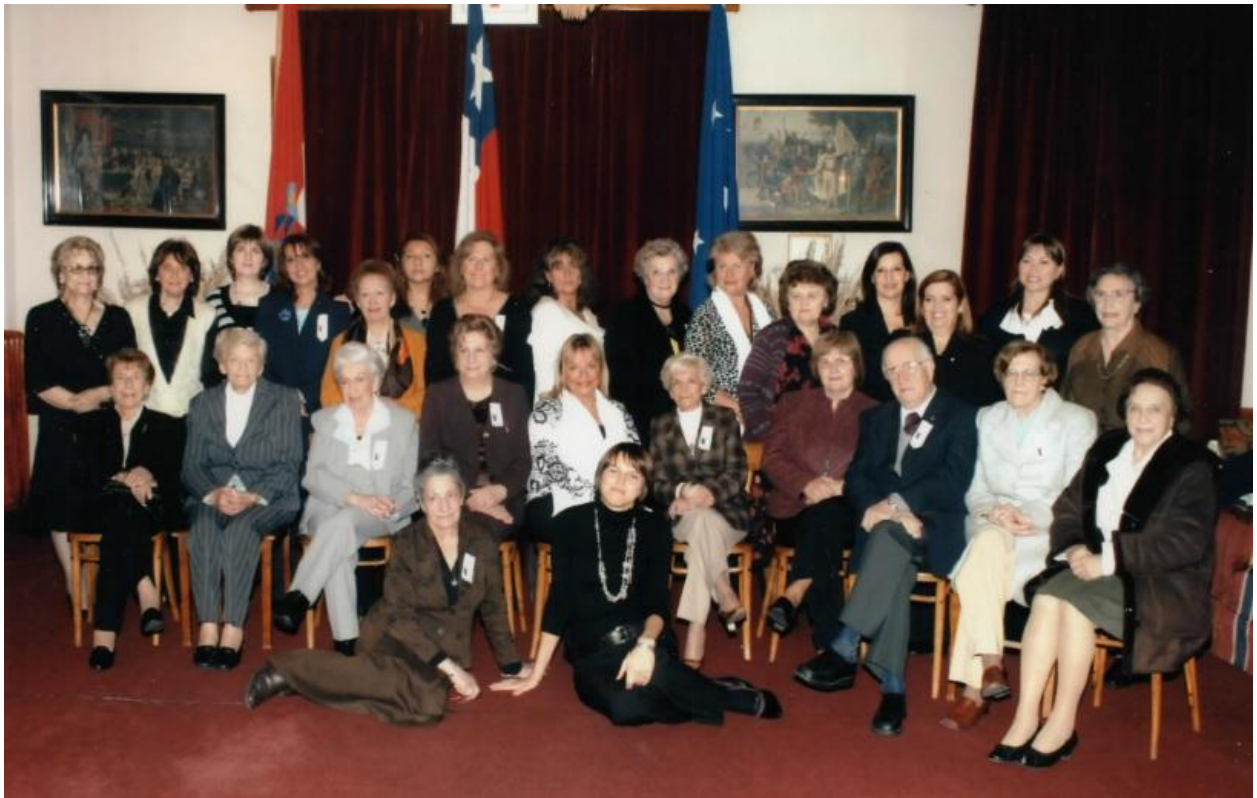
Con las Damas Croatas de Punta Arenas en el Club Croata de esa ciudad