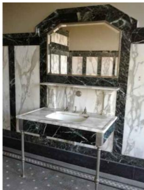
Palacio Pascual Baburizza en Valparaíso

Durante el invierno de 1941, luego de una fuerte bronquitis en Valparaíso, por recomendación médica se había ido a recuperar a Los Andes, en su Hacienda San Vicente, de clima precordillerano.