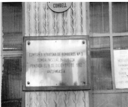
Placa recordatoria en la 3ra. Cía. de Bomberos de Antofagasta