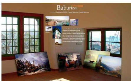
Palacio Pascual Baburizza en Valparaíso