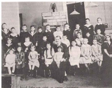
Colegio Yugoslavo de Antofagasta