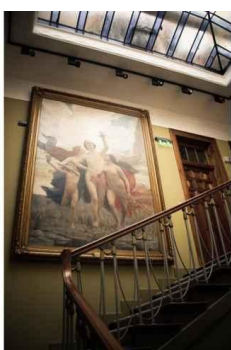
Palacio Pascual Baburizza en Valparaíso