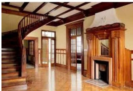
Palacio Pascual Baburizza en Valparaíso