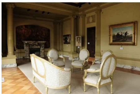
Palacio Pascual Baburizza en Valparaíso