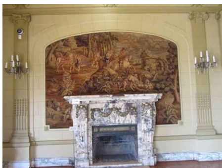
Palacio Pascual Baburizza en Valparaíso