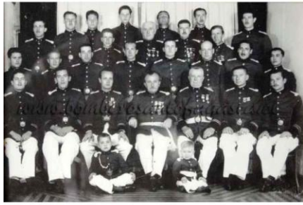
3ra. Cía. de Bomberos de Antofagasta