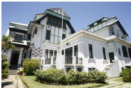
Palacio Pascual Baburizza en Valparaíso