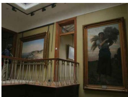
Palacio Pascual Baburizza en Valparaíso