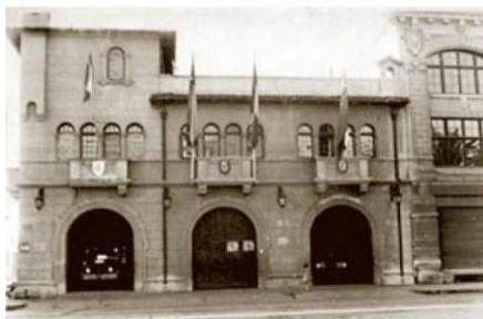
9na. Cía. de Bomberos Zapadores Freire de Valparaíso