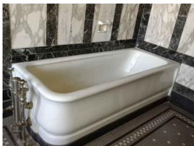
Palacio Pascual Baburizza en Valparaíso