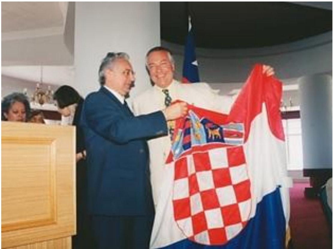
Pedro recibiendo la bandera de Croacia de parte del presidente croata, Franjo Tuđman (1994)