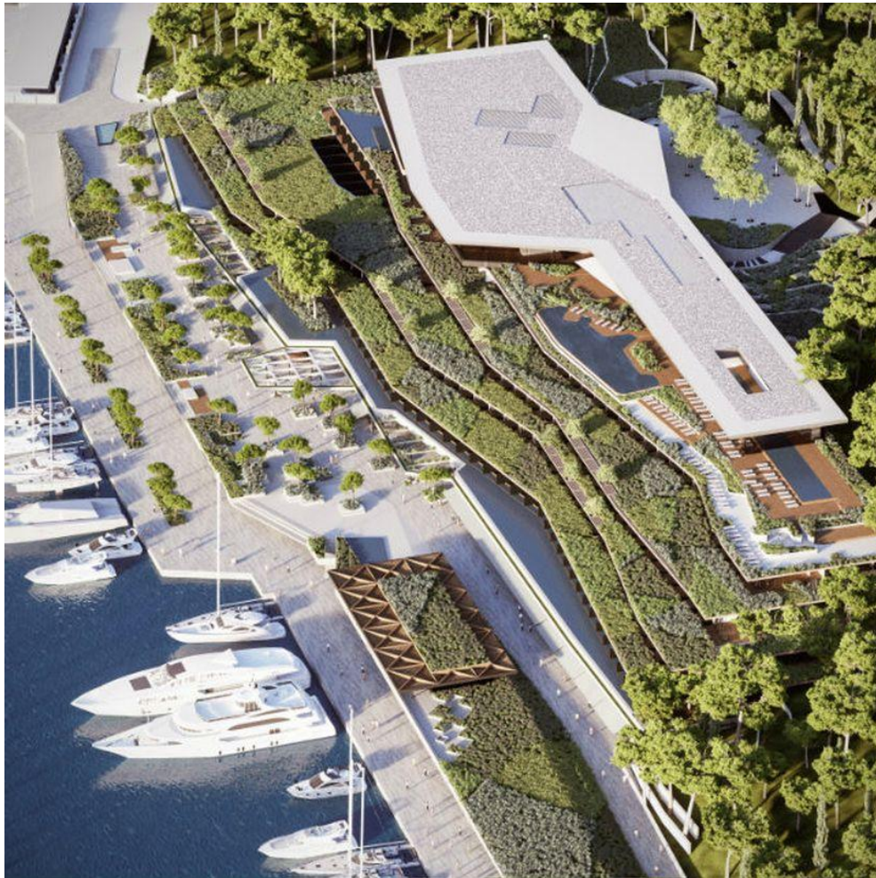
Grand Park Hotel Rovinj (3LHD)

El hotel Grand Park se encuentra en el sitio del antiguo Hotel Park y se encuentra a 10 minutos a pie de la ciudad de Rovinj. El nuevo hotel de 6 niveles, que tiene impresionantes vistas del casco antiguo, contará con 193 suites y 16 suites de lujo con vistas al casco antiguo de Rovinj, las islas y el mar.