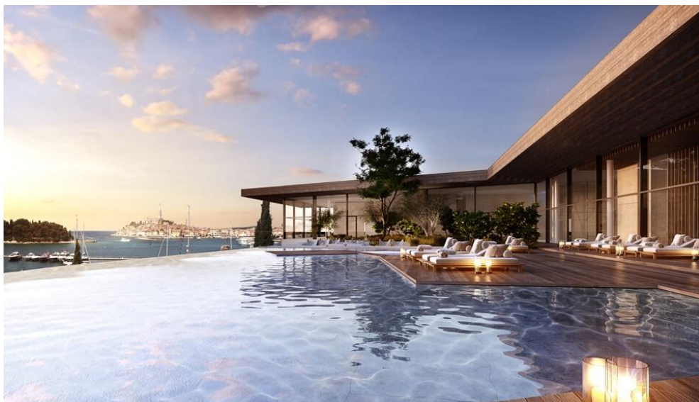
Vistas de Rovinj (3LHD)

El hotel Grand Park se encuentra en el sitio del antiguo Hotel Park y se encuentra a 10 minutos a pie de la ciudad de Rovinj. El nuevo hotel de 6 niveles, que tiene impresionantes vistas del casco antiguo, contará con 193 suites y 16 suites de lujo con vistas al casco antiguo de Rovinj, las islas y el mar.