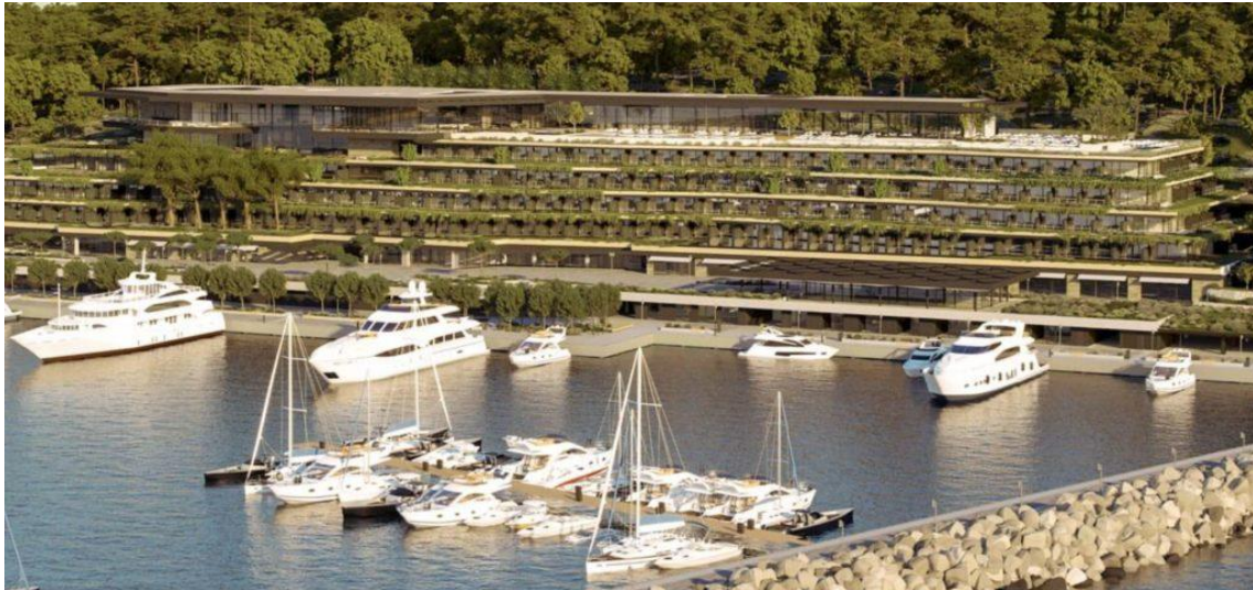
Grand Park Hotel Rovinj (3LHD)

El nuevo y lujoso hotel de 5 estrellas Grand Park en Rovinj abrirá oficialmente sus puertas en abril de 2019.