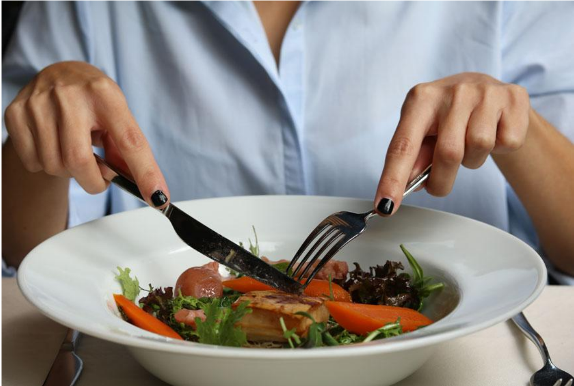
Dubravkin puesto en Zagreb

Croacia se ha añadido a la Guía Michelin - Principales ciudades de Europa 2019.