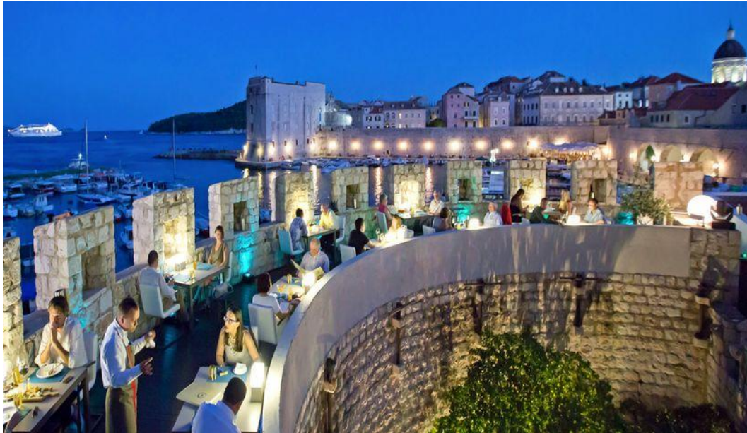
Restaurante 360 en Dubrovnik

En Croacia, actualmente hay 62 restaurantes con una estrella Michelin o un plato (recomendado). Los tres restaurantes con estrella Michelin en Croacia actualmente son Pelegrini en Šibenik, 360° en Dubrovnik y Monte de Rovinj.