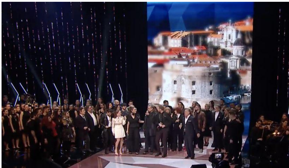
Band Aid 2020

El viernes 6 de marzo, por la noche, se estrenó una nueva versión de una legendaria canción croata grabada en 1991 por los músicos más destacados de la nación en ese momento.