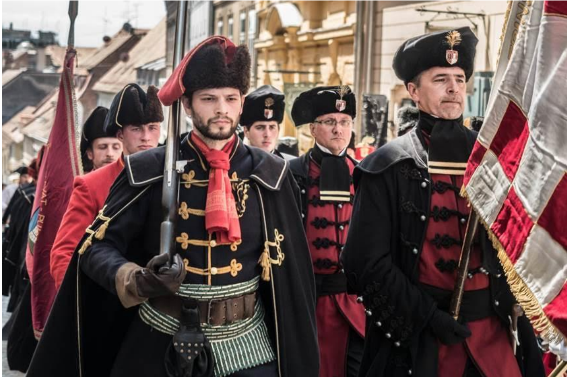
Regimiento Cravat