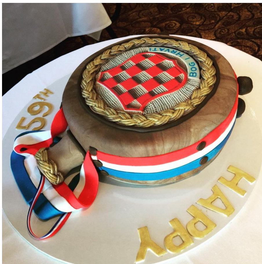
Pastel Čuturica croata

Un čuturica es un frasco de madera tradicional croata que se utiliza para almacenar alcohol y es uno de los símbolos más reconocibles de Croacia. También se encuentra en la mayoría de los hogares de la diáspora.