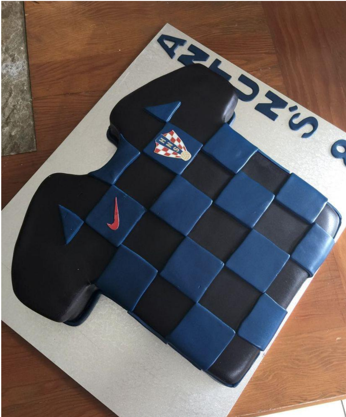
Uniforme de visitante de Croacia 2018 en la Copa del Mundo

Puedes ver más de las creaciones de Valentina en su página de Instagram - @ValentiinaToto