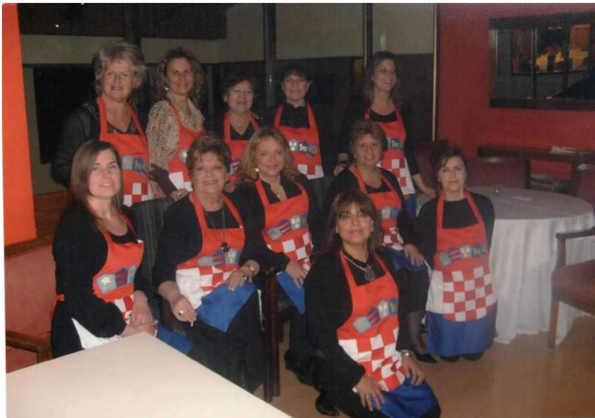
En otra tallarinata