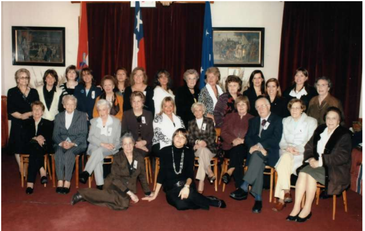
Con las Damas Croatas de Punta Arenas en el Club Croata de esa ciudad