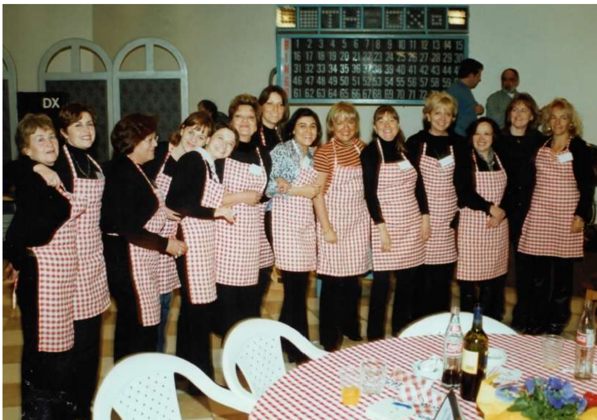
En una tallarinata