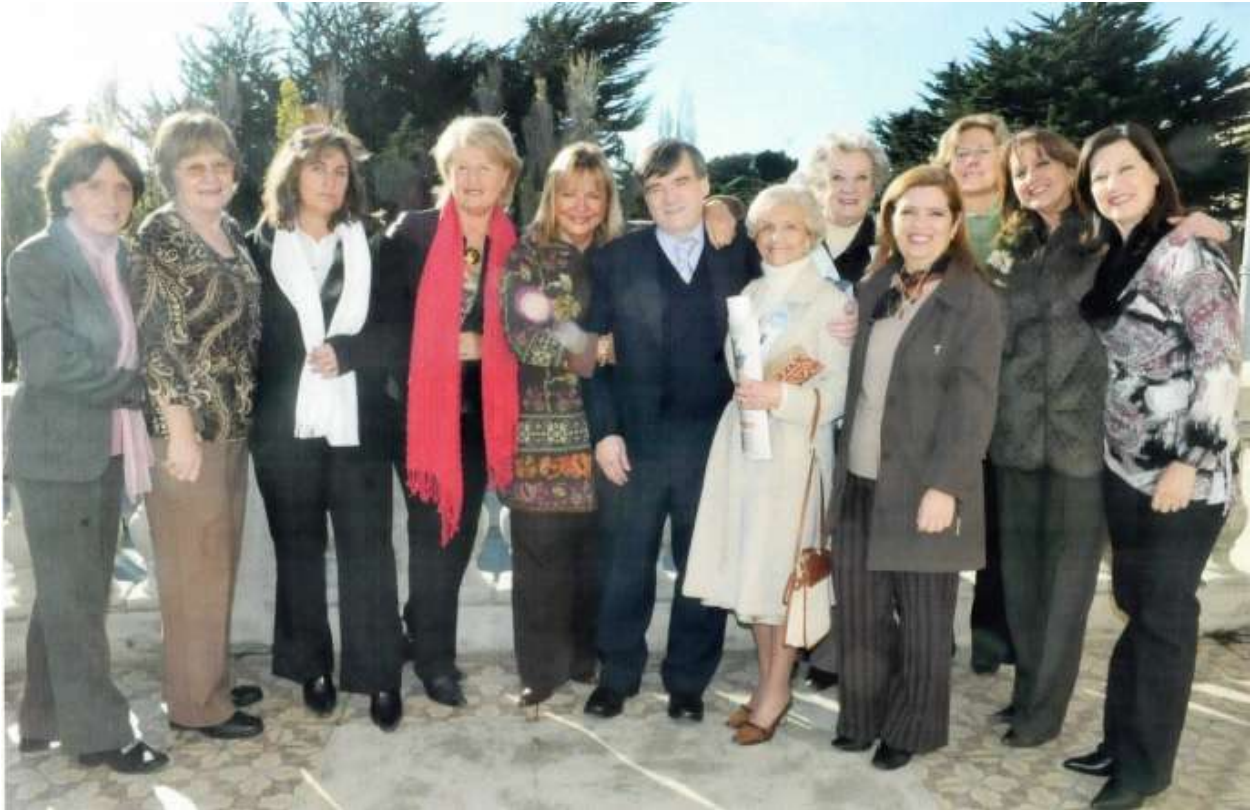
Con el Alcalde de Punta Arenas Vladimiro Mimica