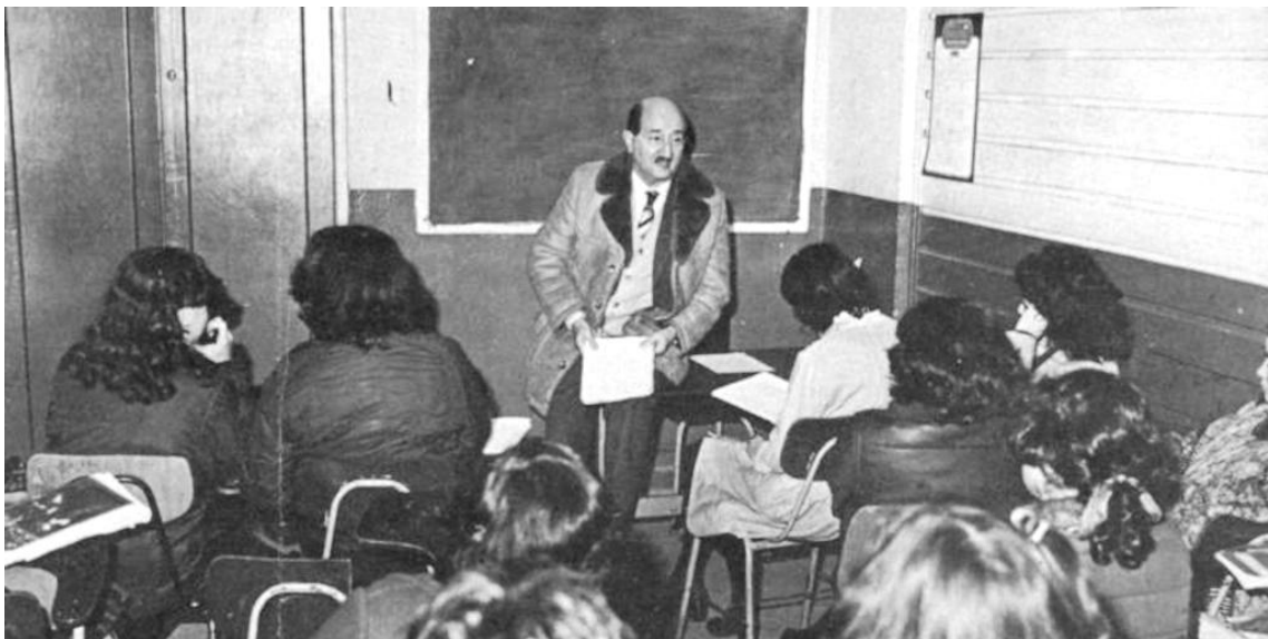
Enseñando en el Liceo B-42 de Niñas de Santiago.