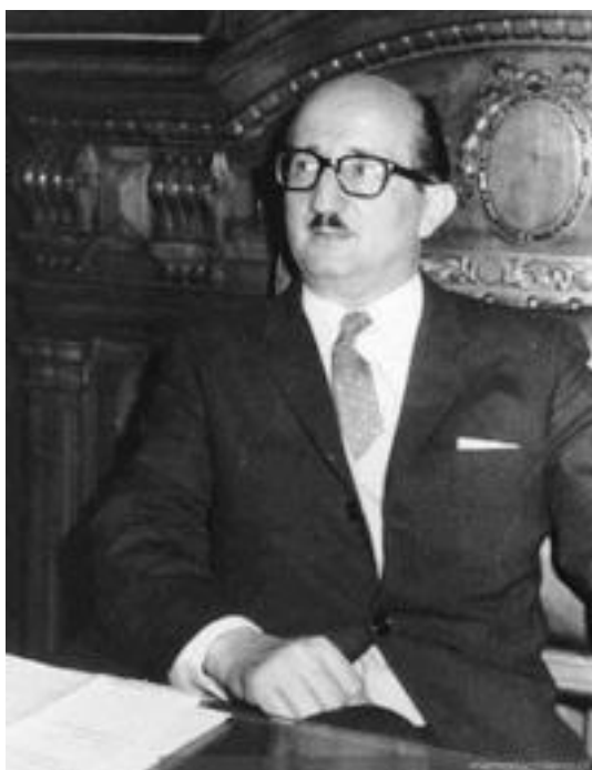
Época de director de la Biblioteca Nacional, 1968