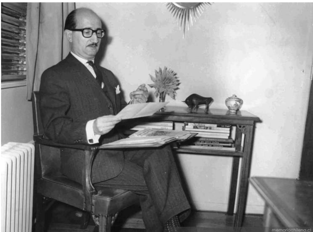
Época del Centro de Investigación de Literatura Comparada, 1966