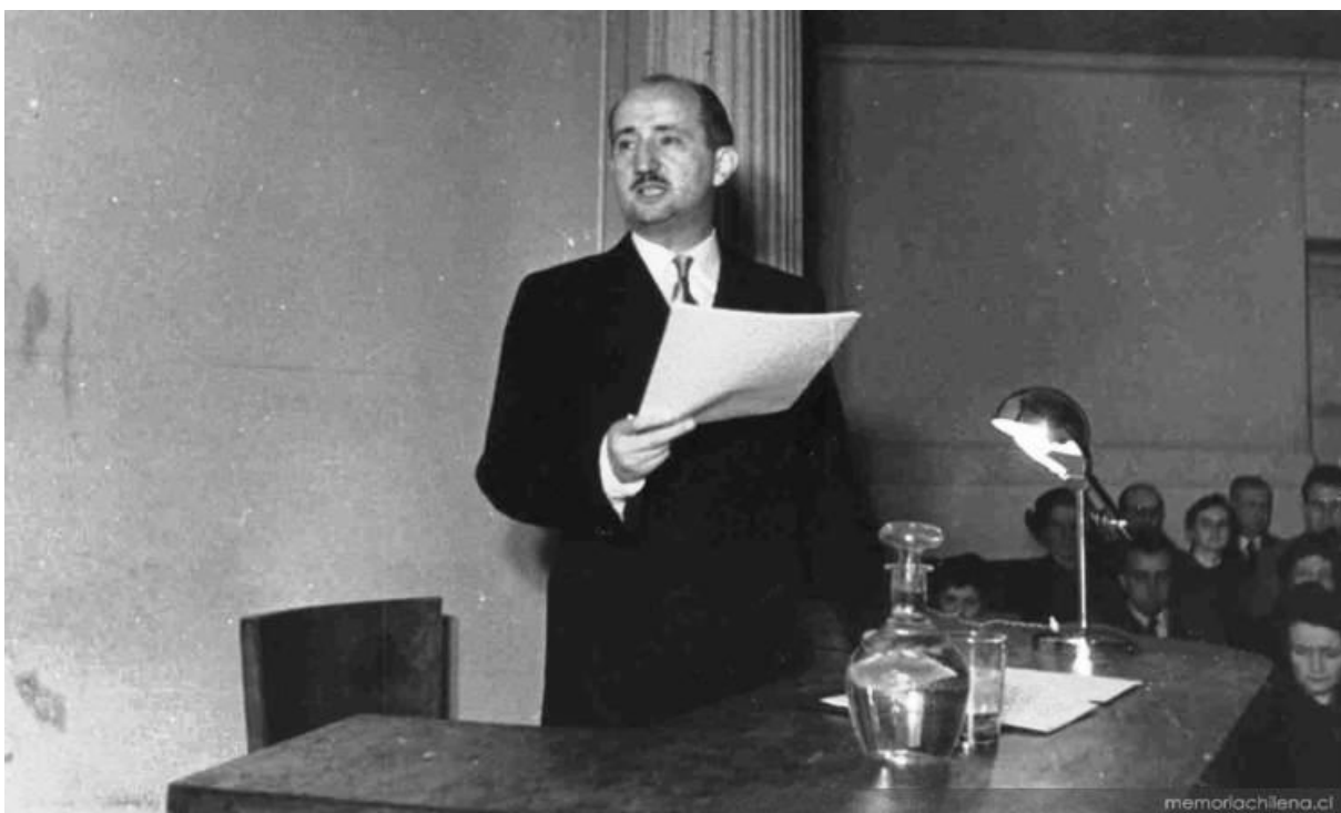
Época de su Incorporación a la Academia Chilena de la Lengua, Santiago, aprox. 1952