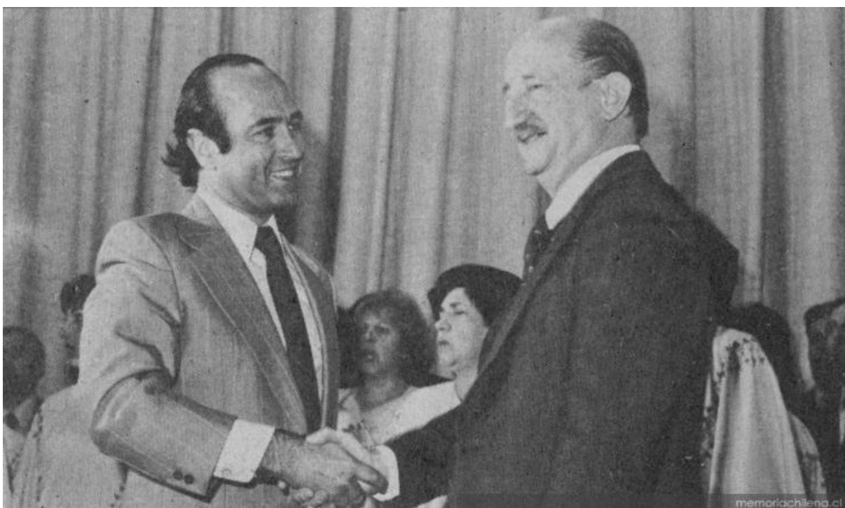
Recibiendo el Premio Nacional de Literatura, 1980