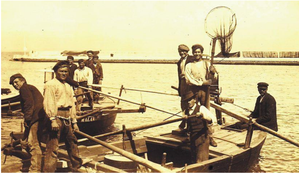
Pescadores de Sutivan, Isla de Brač

El autor de "Saludo de una Dalmacia olvidada", la mayor monografía con postales antiguas publicada en Croacia, Igor Goleš, ha lanzado su propio sitio web con el mismo tema: Zaboravljena Dalmacija.